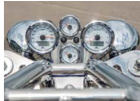
Hochglanz: klassische Anzeige-Instrumente in Chrom