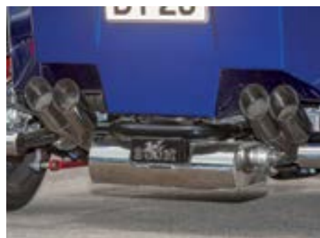
Auspuff: leise im Stand aber klangvoll bei Gasgeben

nicht geschaltet und schon gar nicht gebremst werden soll. Den Job übernimmt eine Automatik, deren ausgesprochen niedlicher Wahlhebel sich mitten auf der Tank-Attrappe befindet. Wer den Gangwechsel selbst bestimmen möchte, kann das über zwei Druckknöpfe mit dem linken Daumen erledigen – tiptronisch also.