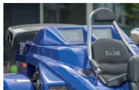
... fallen freilich die Lufteinlässe für den Turbo auf