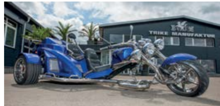
Made im Schwabenland: Mustang Xtreme von der Trike-Manufaktur