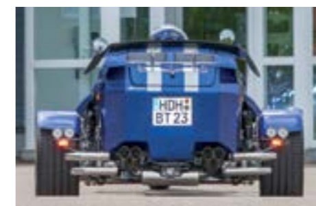
Auspuff: tönt klangvoll im Galopp