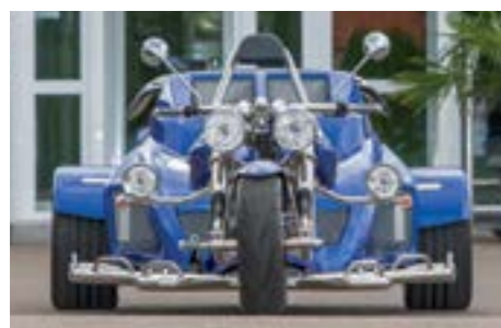
Von vorne: typisch Mustang. Auf den zweiten Blick...