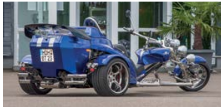
Heck: klangvoller Vierrohr-Auspuff und tourentauglicher 240-Liter-Kofferraum