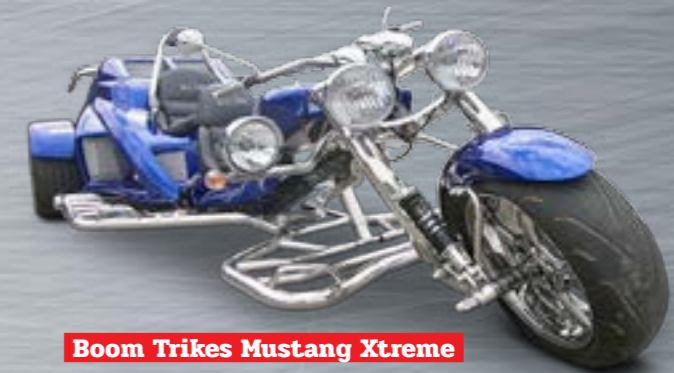
Boom Trikes Mustang Xtreme

Dem Boom-Trikes-Team ist es gelungen, seinen Mustang Xtreme auch mit dem 200 PS starken Triebwerk nicht mit den Manieren eines unbändigen Wildpferd ins Rennen zu schicken, sondern mit der Überlegenheit eines dynamischen und dennoch alltagstauglichen Tourers – ein herrliches Fahrgefühl, das dem Piloten allerdings 49.900 Euro wert sein muss.