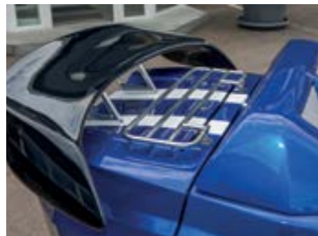
Gepäck-Gitter & Heckspoiler