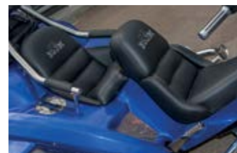
Sitze: nur 420 bzw. 630 mm über dem Asphalt