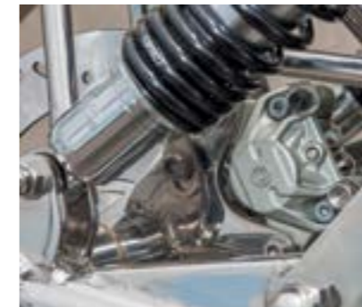
Front-Anker: Brembo Bremszange