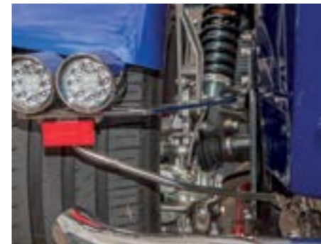
Eng: zwischen Antrieb und Rädern